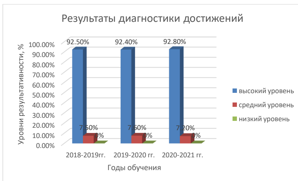
Рисунок 1. Сравнительный анализ результатов обучения за три года

Диагностические исследования учебно-воспитательного процесса проводятся по результатам освоения дополнительной общеобразовательной общеразвивающей программы: предметные, метапредметные и личностные результаты. Используется следующая шкала оценивания: высокий, средний и низкий уровни. Результаты диагностики по программе (внутренние достижения) приведены в диаграмме (рисунок 1).