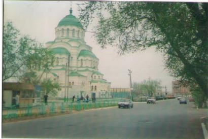
Улица имени Степана Здоровцева